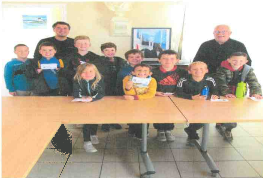
Nos journalistes en herbe posent avec M le Maire sous la Marianne, symbole de la République.

M : « Bien sûr, j'aime le contact avec les gens et c'est primordial quand on est élu par les Gracieuses et Gracieux. »