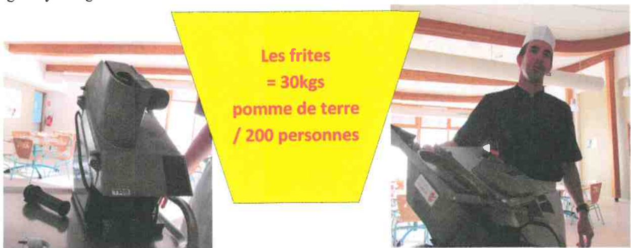
Régis avec l'une de ces machines à découper

M : « Je commence à 7h du matin (réaction de nos journalistes : « c'est tôt ! ») par vérifier les frigos pour voir s'ils sont toujours en fonctionnement. Ensuite je me mets en lien avec les fournisseurs, ceux qui livrent les produits alimentaires, pour passer commande et vérifier la bonne livraison. Quand j'ai tous les produits, je prépare le repas grâce à des machines spéciales. Quand l'heure de midi arrive, je sers les personnes accueillies à la cantine. Enfin, après le repas jusque 14h45, je fais le ménage en nettoyant mes outils et la cuisine car en restauration collective, les règles d'hygiène sont drastiques. Il en va de la santé des enfants et des agents y mangeant. »